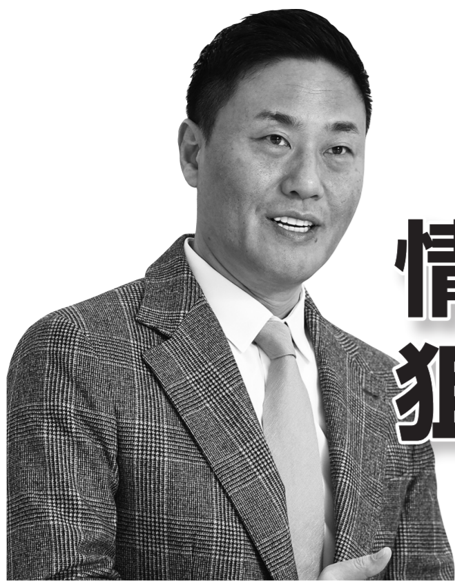
株式会社セキュアソフト、サービス&セキュリティ株式会社 代表取締役社長