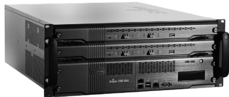
次世代IPS、DDoS対策 [SecureSoft Sniper ONE]

姜 インターネットの商業利用が進んだ1990年代半ば、米国の大手金融機関がハッキングされて大金を盗まれました。そうした事件を受けて、民間企業でもサイバー攻撃への備えが必要だと認識が広がりました。当時、狙われたのは主にマネーですが、現在は、マネーになる、あるいはもった大きな価値を生む情報資産、データが狙われています。したがって、そのような重要情報資産が漏えいすることは企業の信用失墜や事業継承の危機をまねかかねません。そういう時代になったことを認識する必要があります。